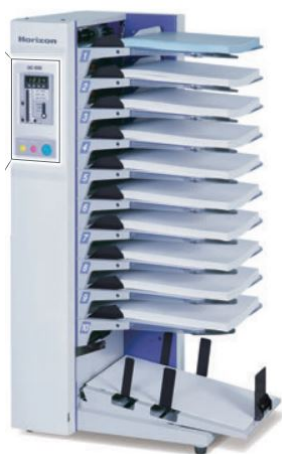
丁合(ページ合わせ)作業が簡単

○企業で作成された印刷物・書類を手間なく順番通りに並べた複数のセットを自動で丁合（束ねる）することが出来ます。最初は、チラシ1枚だったDM等も、今では4～5種類のチラシ！という方もいらっしゃるのではないのでしょうか？ページ数が増えて大変なのは、印刷したそれぞれのページをセットするとき。机の上に並べて、順に重ねながら行ったり来たりするのは大変ですよね。そんな時に役に立つのが「丁合機」です。セットしたい書類を上から順番にセットして、スタートを押せば、あっという間にでき上がります。ぜひ、ご利用ください。