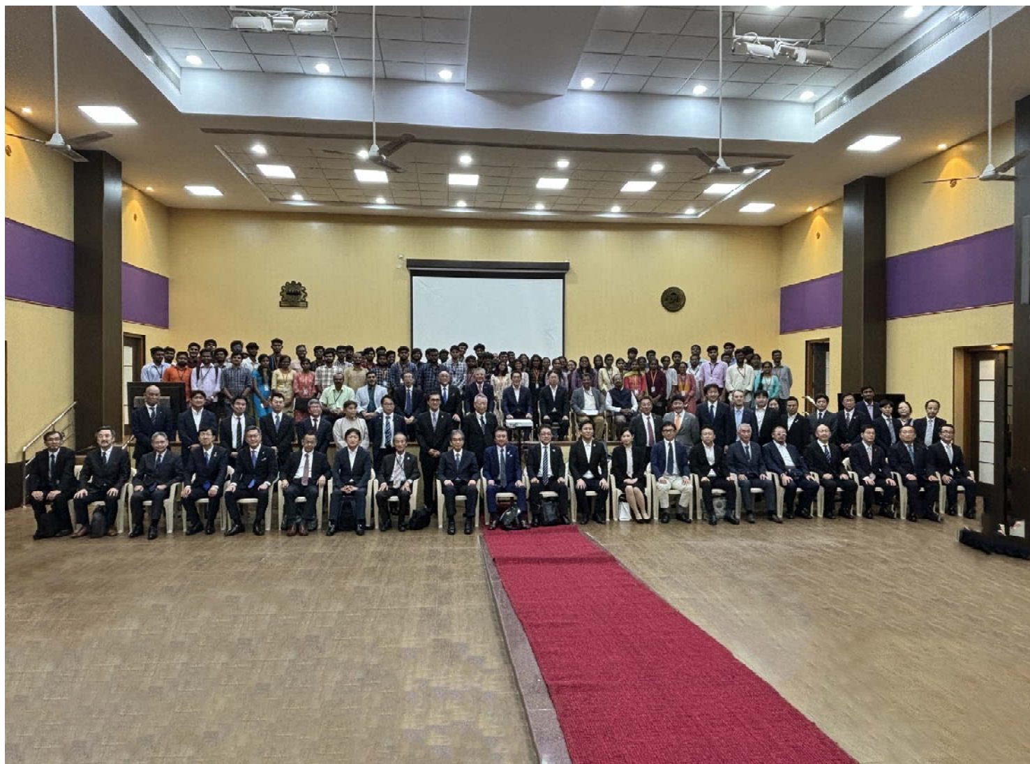
【インド経済ミッション ANNA大学での集合写真】

● 令和 6 年度 事業計画・収支予算が承認されました ● 令和 5 年 下半期 景気動向調査結果