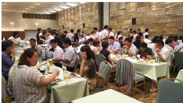
暑い日が続く中、冷たいビールは本当に美味しい!

は13名の参加があり、賑やかに交流することができました。ご参加いただいた皆さん、お忙しいところ、ありがとうございます。 美味しい料理と、冷たいビール、楽しいおしゃべりで、青年部との有意義な交流ができたかなと思います。