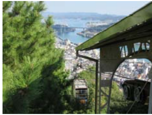
千光寺 → ロープウェー 頂上からの 眺め

またこの日は、本通り商店街センター街で「尾道ベッチャー祭り」という地域伝統のお祭りが開催されていて、出店もたくさん出ていて、とても賑わっていました。