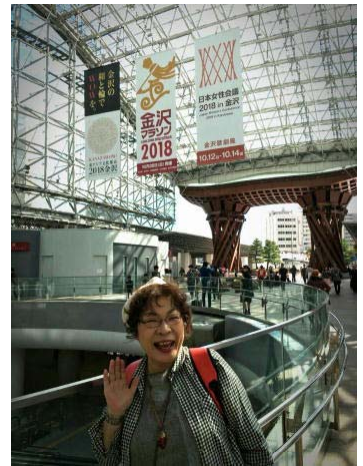
金沢駅でも日本女性会議の垂れ幕が！