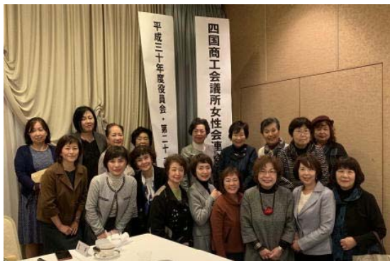
愛媛県連の皆さんで記念撮影

総会後には、会員増強に関する活動事例発表と意見交換会が開催され、全女性会が抱えている問題なのだということを実感しました。当女性会も、会員増強に向けて、何か行動を起こさないといけないなと感じました。