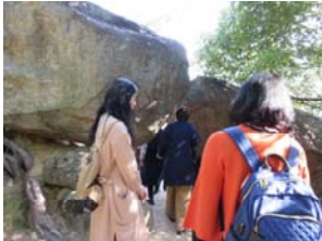
← 岩の間を くぐります。