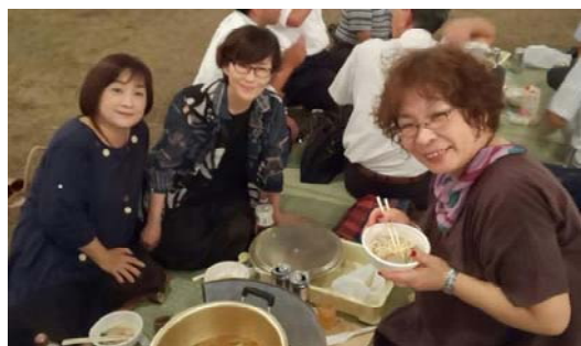
きれいな夕陽と美味しいいもたきで 夏が終わり…秋の訪れ?