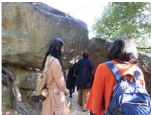
← 岩の間を くぐります。