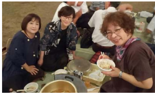
きれいな夕陽と美味しいいもたきで 夏が終わり…秋の訪れ？