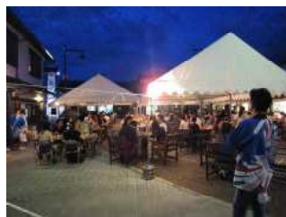
【昨年度開催時様子】