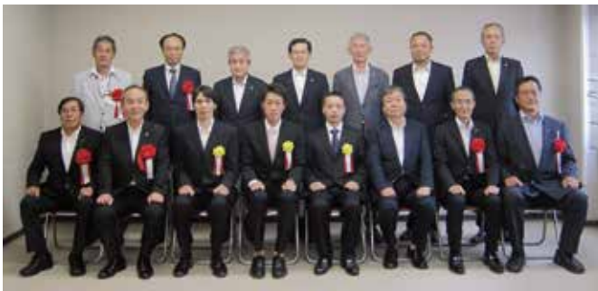
【受賞者及び来賓の方々との記念撮影】