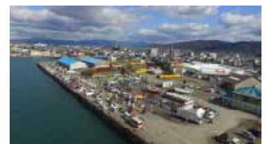
【昨年度開催時様子】